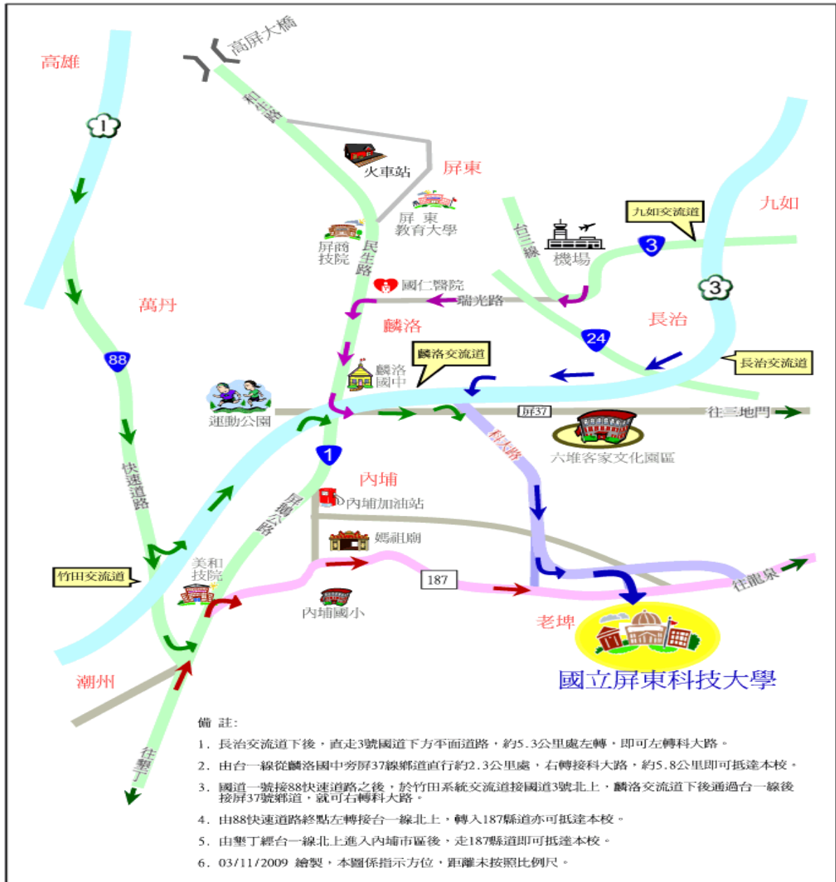
國立屏東科技大學位置示意圖