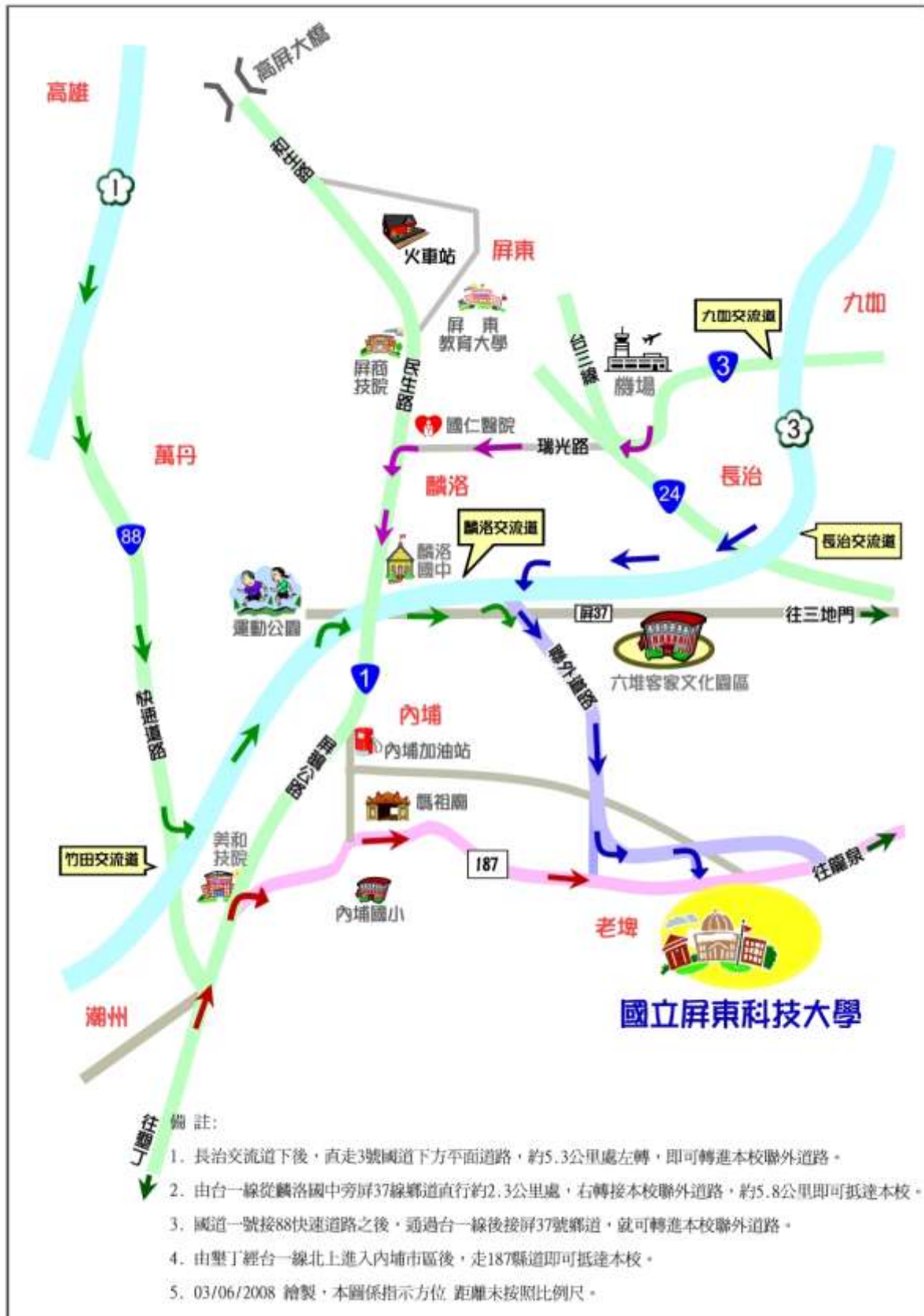
國立屏東科技大學位置示意圖